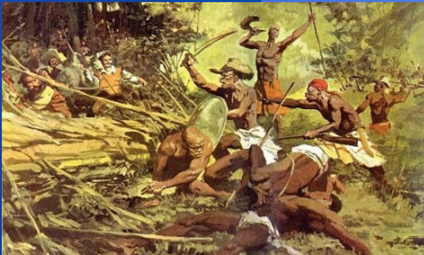
A Guerra dos Palmares. Óleo sobre tela de Manuel Victor, 1955.