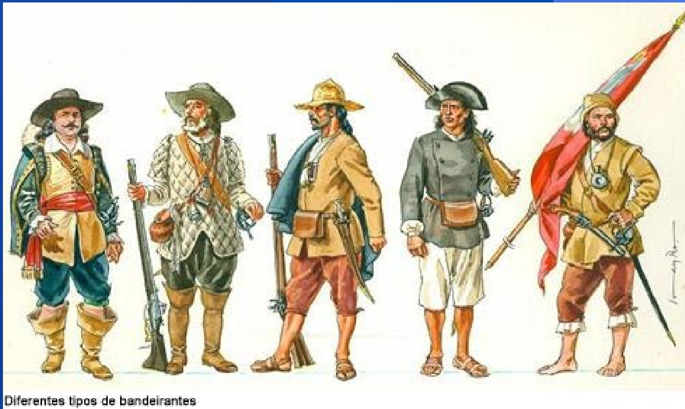
Diferentes tipos de bandeirantes

A vestimenta variava de acordo com a situação econômica do bandeirante para adquirir roupas e acessórios disponíveis nos locais de partida e também em relação ao tempo da viagem, visto que ela poderia durar meses e eles levavam apenas o estritamente necessário e usavam a mesma roupa durante as viagens, os calçados nem sempre duravam até o retorno.