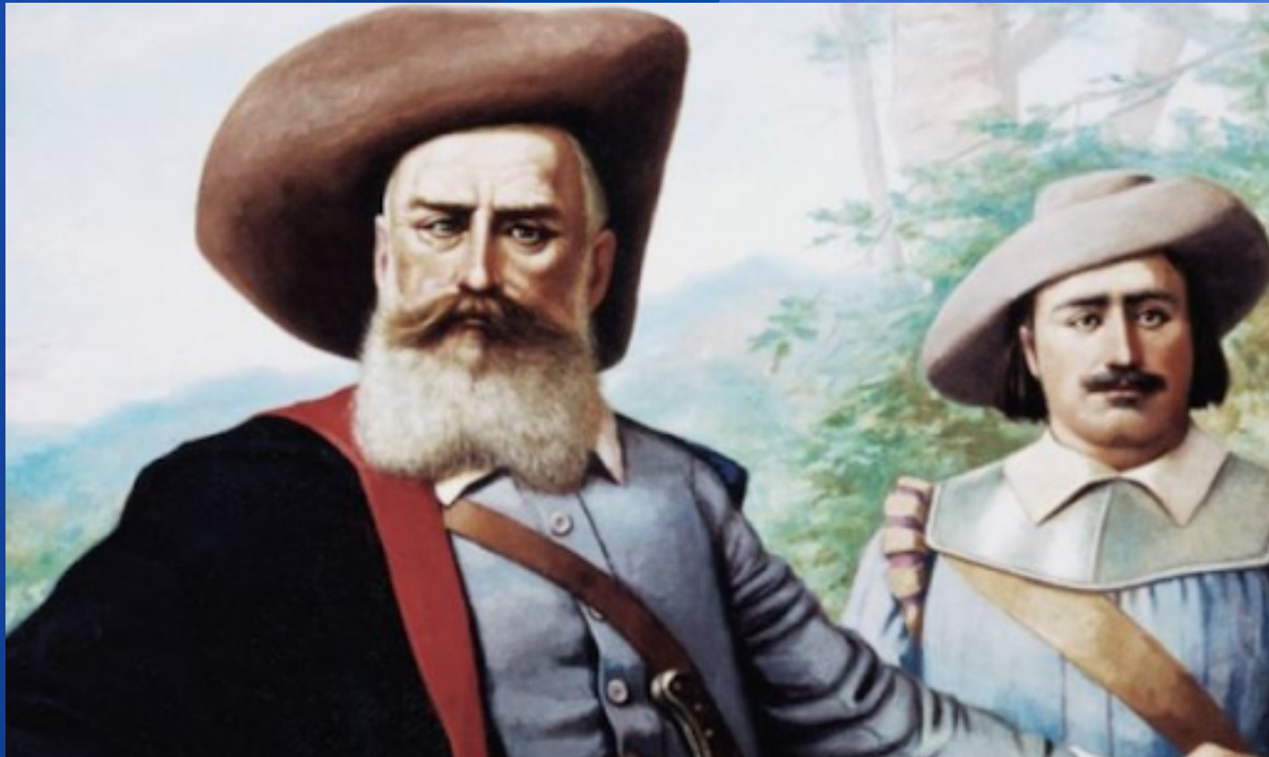
Domingos Jorge Velho.

"Eles eram rudes, geralmente iletrados, passavam longos períodos embrenhados em matas e campos desconhecidos, comiam mal e perseguiram índios. Figuras típicas do Brasil colonial, diretamente responsáveis pelas incursões "do homem branco" pelos confins então desconhecidos do Brasil, os bandeirantes acabaram elevados ao panteão dos heróis"